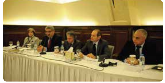
جريدة المستقبل، ١٧ شباط ٢٠١٥

جريدة المستقبل (١٧ شباط ٢٠١٥): "تسعى هذه المبادرة إلى وضع خطة محلية متكاملة مناطقية وإنشاء الخدمات في مجال تعزيز الخدمات الصحية والاجتماعية من أجل زيادة فرص الحصول على خدمات الرعاية الصحية الأولية وبرامج توعية صحية في المدارس الحكومية".