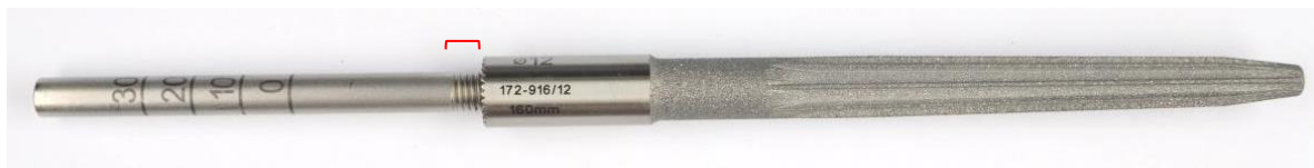
Abbildung 2: Führungsstab kann nicht vollständig in den Schaft eingeschraubt werden / Figure 2: Guide rod can't be screwed into stem completely