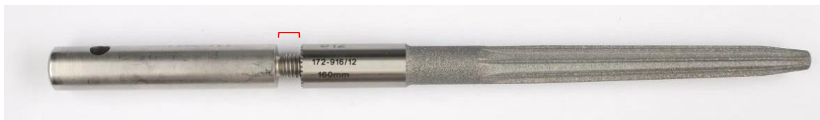
Abbildung 1: Fräsführung kann nicht vollständig in den Schaft eingeschraubt werden / Figure 1: Reaming guide can't be screwed into stem completely