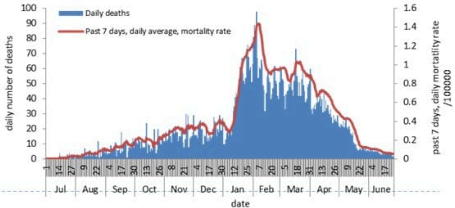
حالات الوفاة ونسب الوفيات حسب اليوم