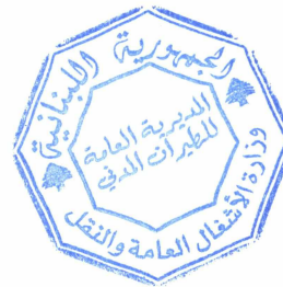
المهندس فادي الحسن